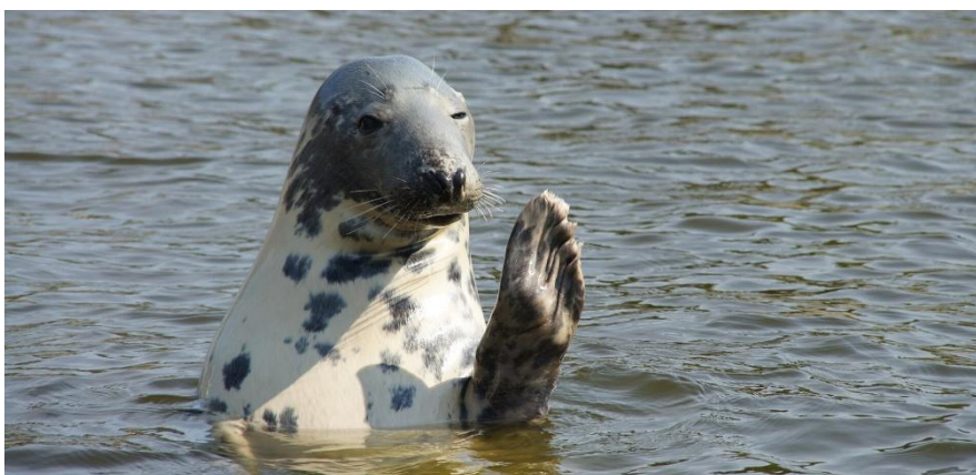
Na terenie Rezerwatu Bråvikens można spotkać szarytkę morską, czyli fokę szarą.

Warto zapoznać się z relacjami z poprzednich wyjazdów na stronie www.wioslo.pl/wyprawy .