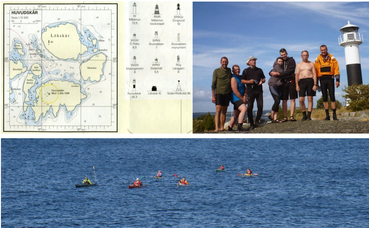
Mapa morska i zdjęcie kajakarzy, który dopłynęli do Huvudskär w 2013 r.

Warto zapoznać się z relacjami z poprzednich wyjazdów na stronie www.wioslo.pl/wyprawy .