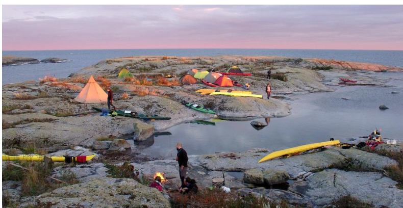
Biwak na wyspie Stora Garkast na terenie Rezerwatu Hartsö podczas BPW 2016 r.

Warto zapoznać się z relacjami z poprzednich wyjazdów na stronie www.wioslo.pl/wyprawy .