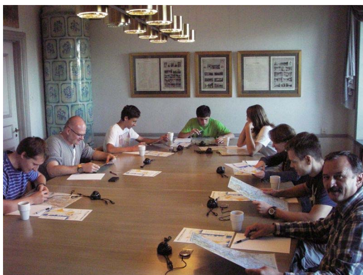
Pierwsze szkolenia z nawigacji „na sucho”