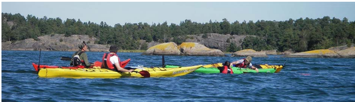
Ćwiczenia z technik ratowniczych już na morzu