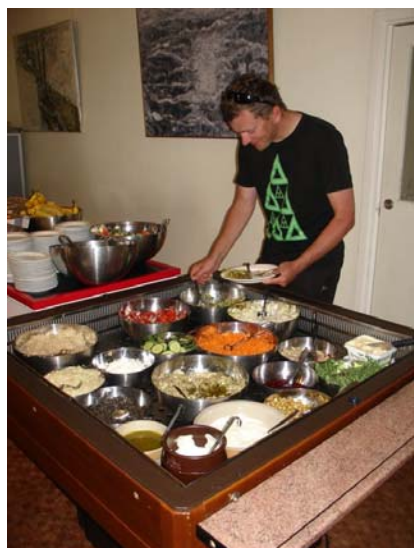
Bufet szwedzki to standard żywieniowy

Warto zapoznać się z relacjami z poprzednich wyjazdów na stronie www.wioslo.pl/wyprawy (relacja wraz ze zdjęciami z ubiegłego roku: http://wioslo.pl/wyprawy/baltyk-pod-wioslem-2013 ).