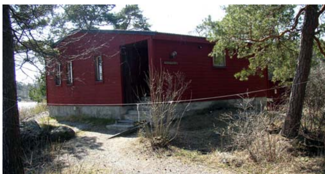
Pawilon „Tallstugan” – miejsce zakwaterowania

godz. 10.30 – wyjazd grupy z Polskiej Bazy Kajakowej w Stensunds Folkhögskola na lotnisko Sztokholm-Skavsta i odlot do Polski.