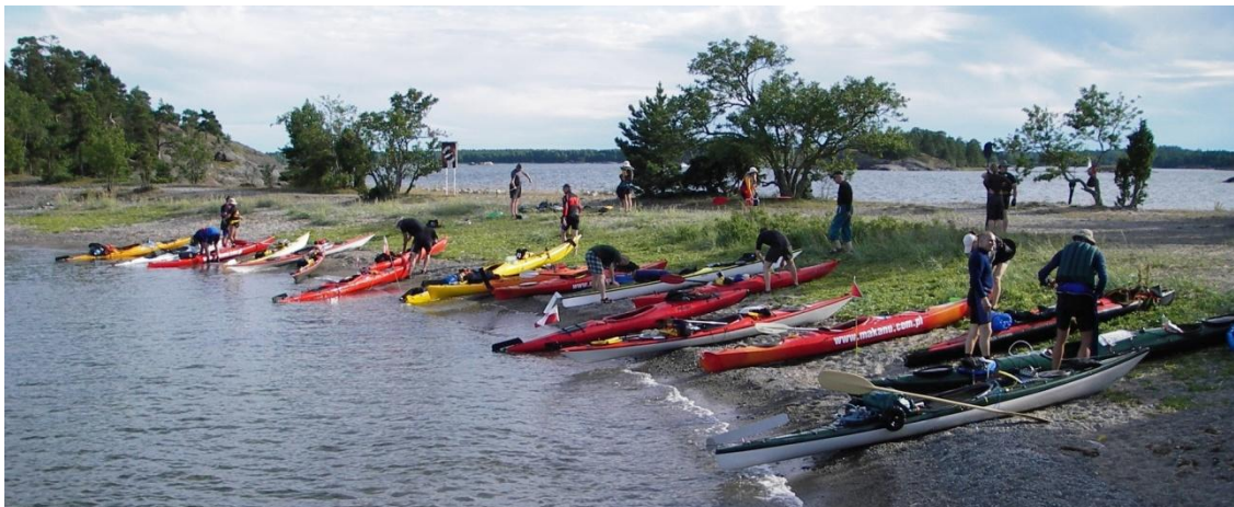
Półwysp Knappelskär - jedno z miejsc biwakowych, na którym z pewnością się zatrzymamy (zdjęcie z „Bałtyku pod wiosłem 2007”).