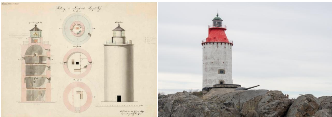
Latarnia morska Landsort ze starej ryciny z 1849 r. oraz współczesne zdjęcie.

Warto zapoznać się z relacjami z poprzednich wyjazdów na stronie www.wioslo.pl/wyprawy .