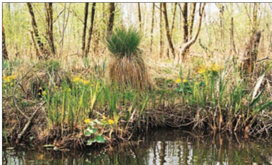
Fot. Joanna Breitko, Marek Lityński